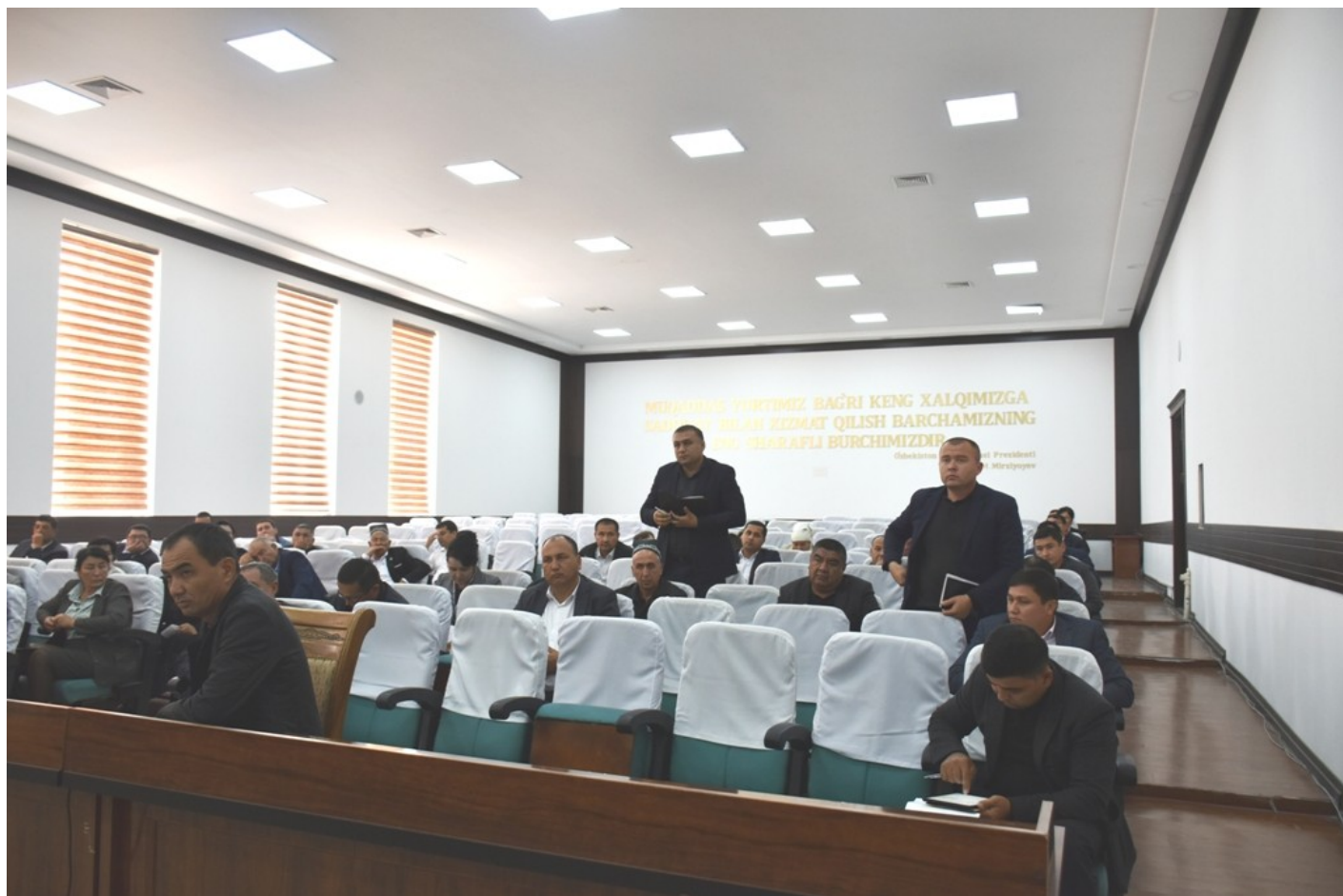
Узун туман ҳокимлиги Ахборот хизмати